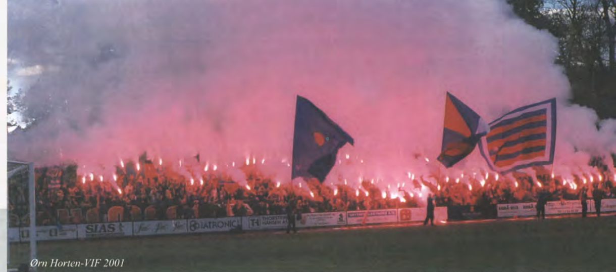
Ørn Horten-VIF 2001