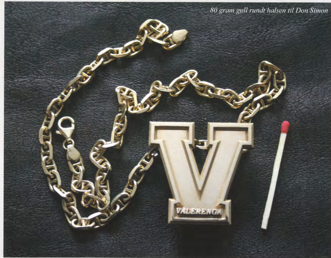
80 gram gull rundt halsen til Don Simon