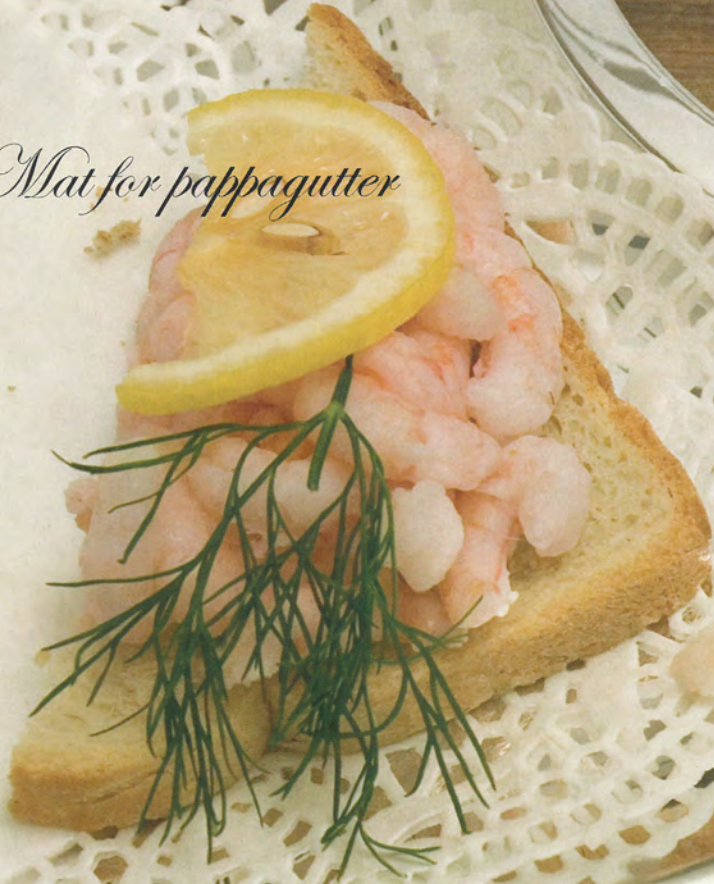
Mat for pappagutter