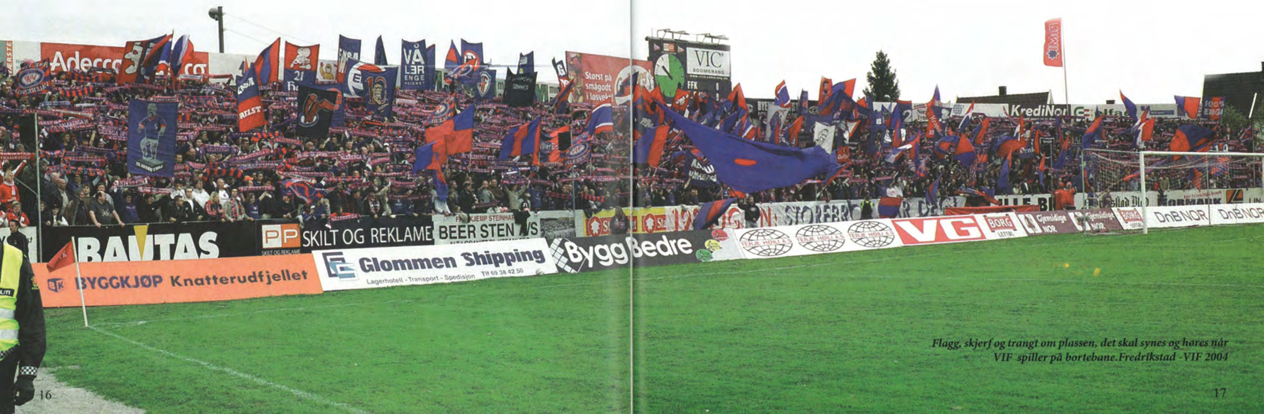
Flagg, skjerf og trangt om plassen, det skal synes og høres når VIF spiller på bortebane. Fredrikstad - VIF 2004

Mange bilder fra denne perioden har ikke vært trykket tidligere, vi benytter derfor anledningen til presentere en bildekavalkade og noen ord om EngaTifo's første leveår.