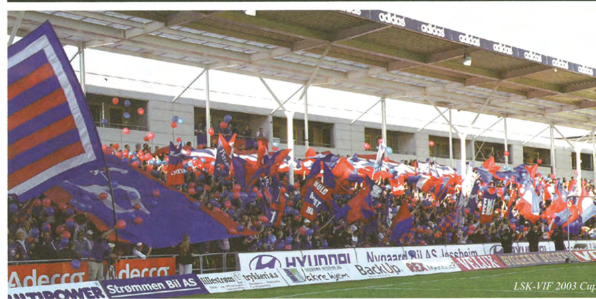
LSK-VIF 2003 Cup